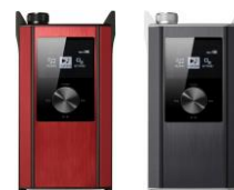
TEAC ポータブルプレーヤー HA-P90SD

ソフトウェアは、タスカムのウェブサイトから無料でダウンロードが可能です。 Mac と Windows に対応しており、Windows 対応版は既に無料配信中です。